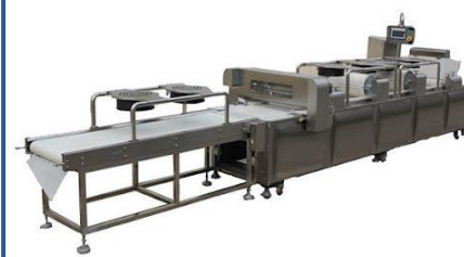
GRN-PS Granola bar