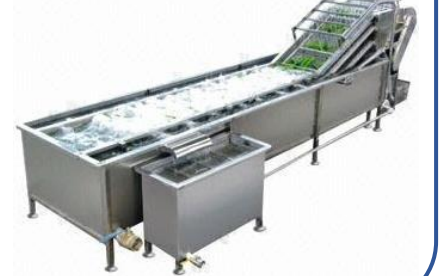
WAS-PS Washing Machine