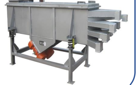
SOT-PS Sorting Machine