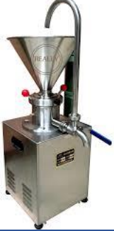
CID-PS Colloid Mill