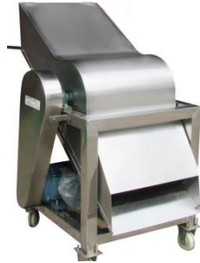
MIL-PS Milling Machine