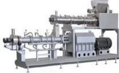
EXT-PS Extruder Machine