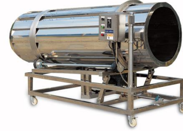
DCF-PS Dry Cool Flavor